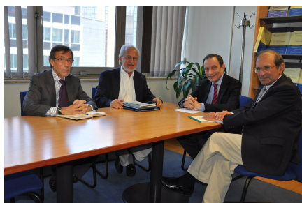
Os directores gerais do IFBM e do IFB com outros responsáveis do instituto português

juntas, tanto ao nível da formação clássica em sala como de seminários de temas de interesse e actualidade para o sistema